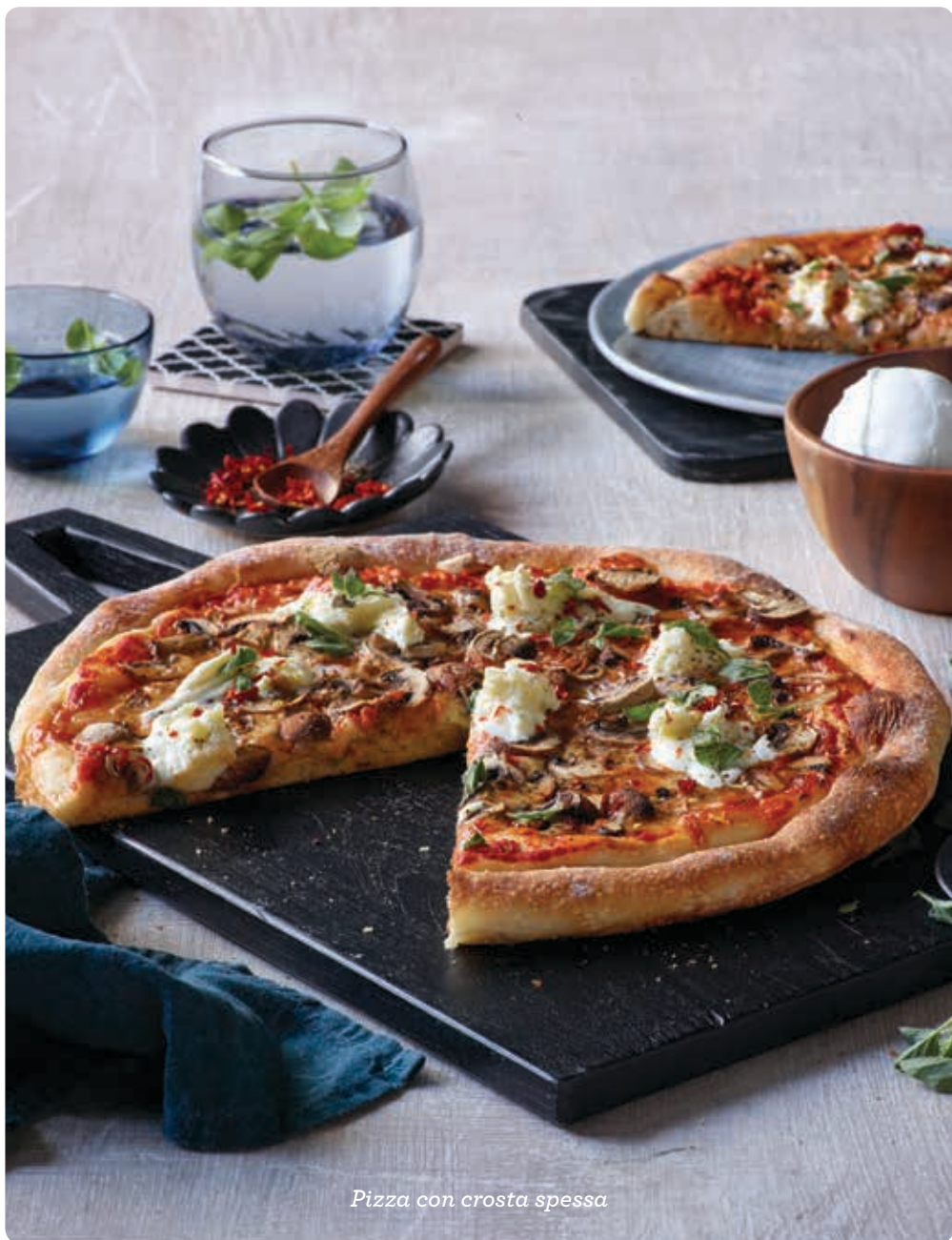
Pizza con crosta spessa