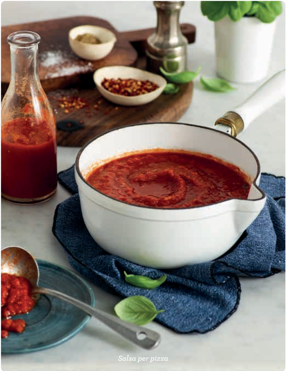
Salsa per pizza