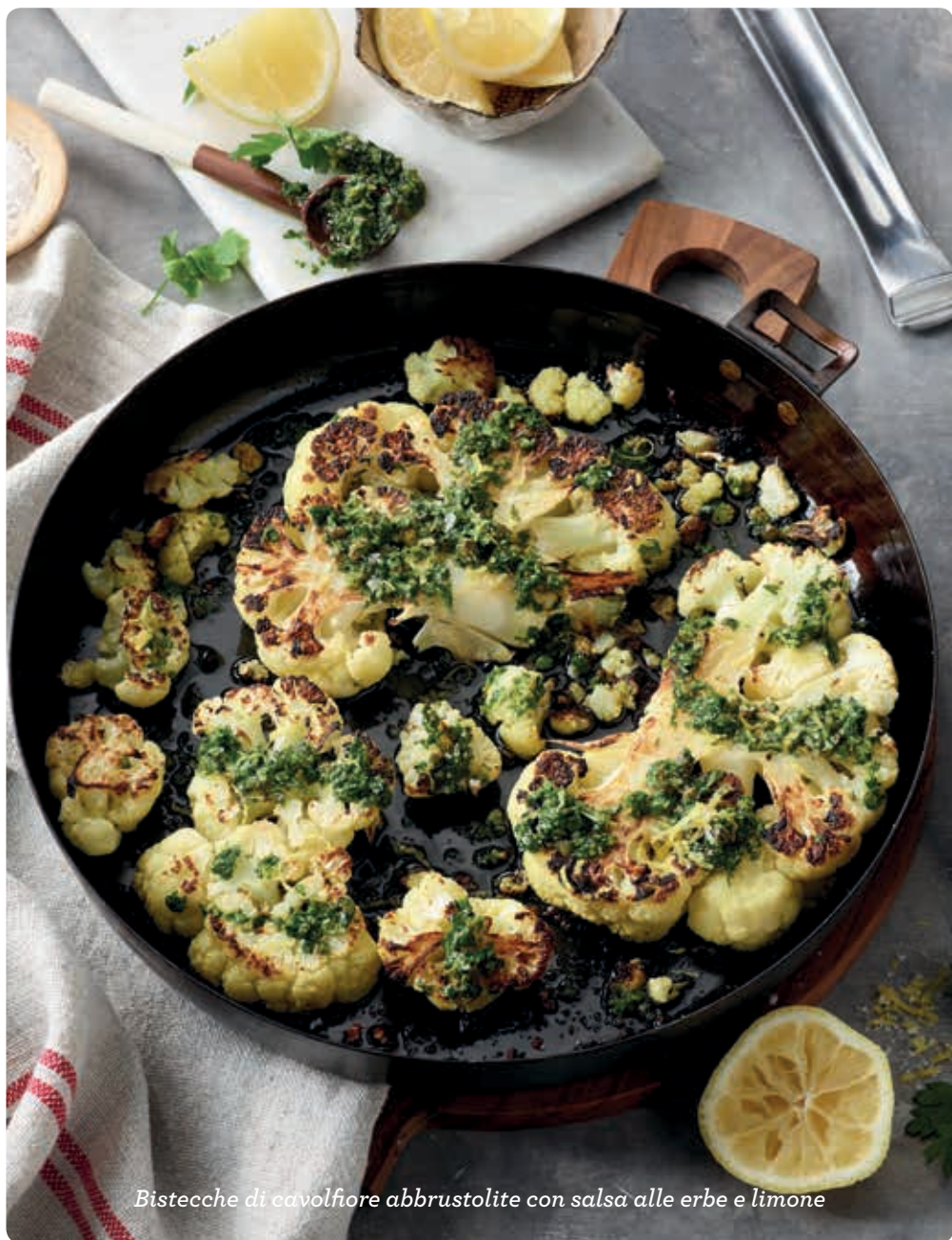
Bistecche di cavolfiore abbrustolite con salsa alle erbe e limone