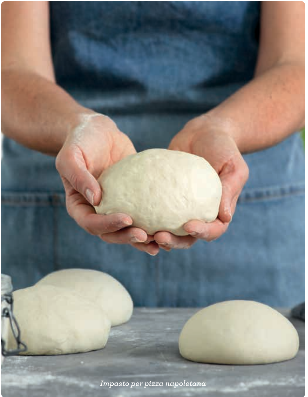
Impasto per pizza napoletana