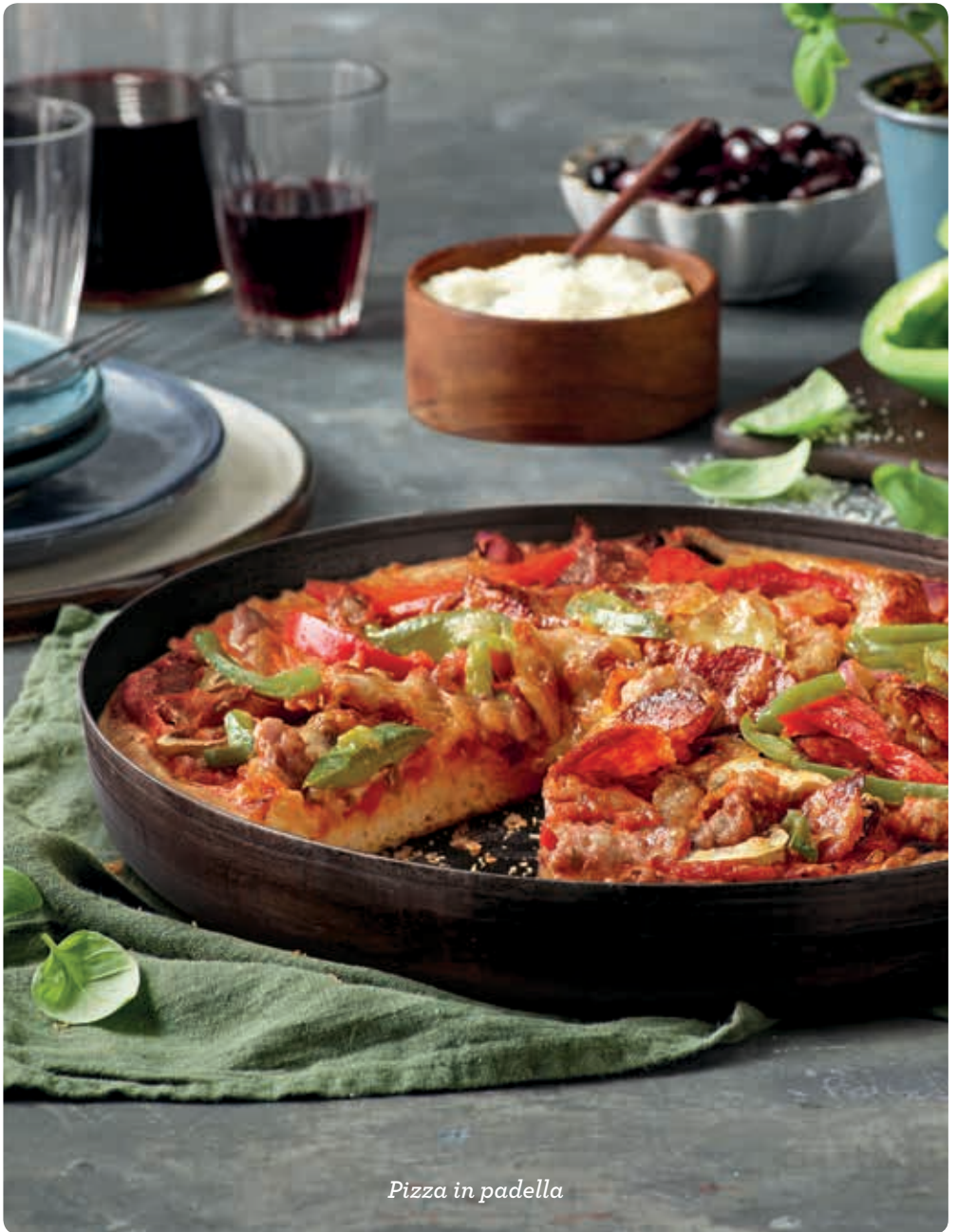
Pizza in padella