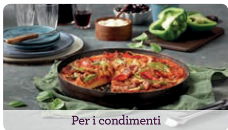
Per i condimenti