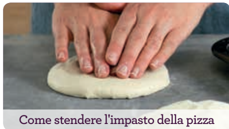
Come stendere l'impasto della pizza