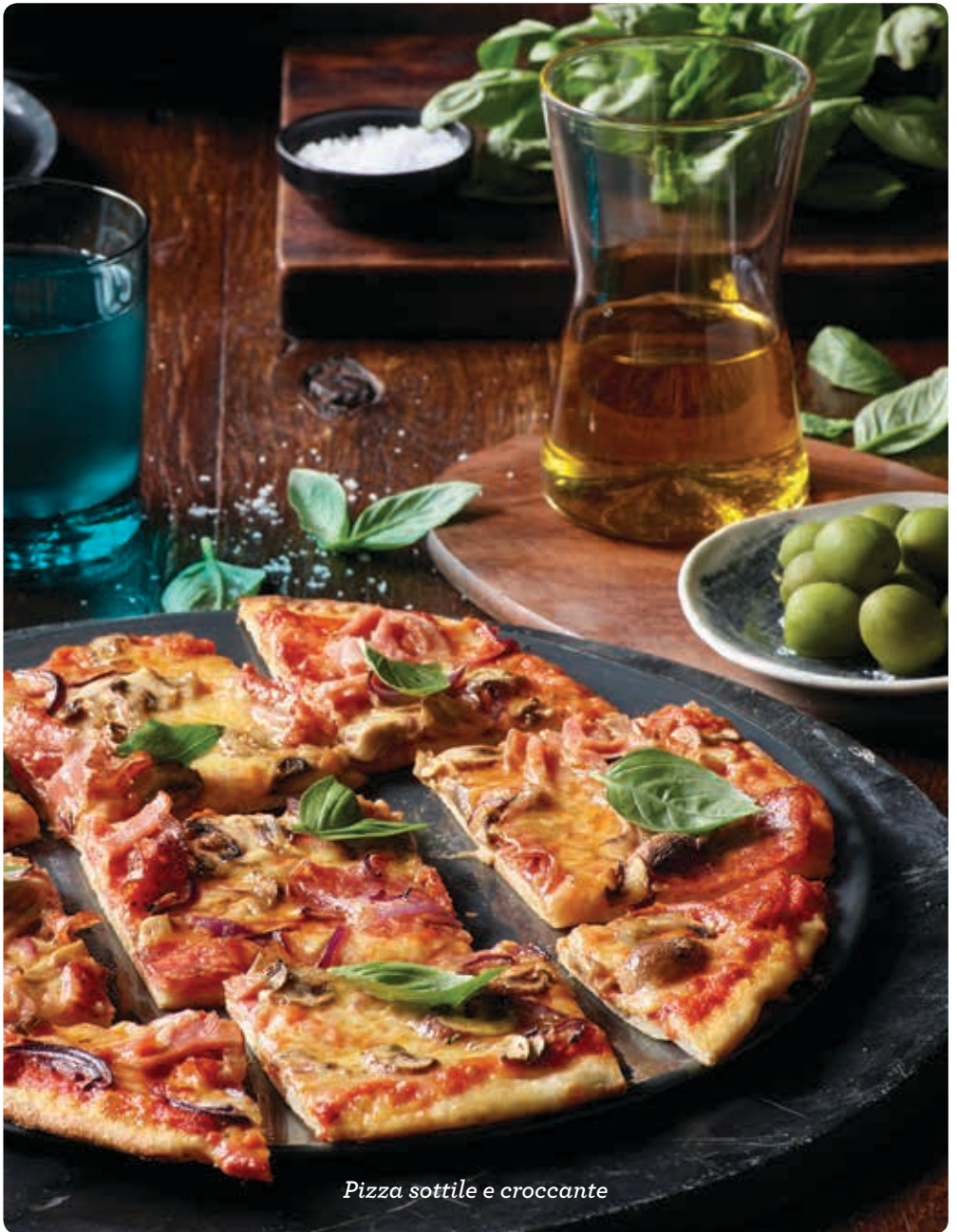
Pizza sottile e croccante