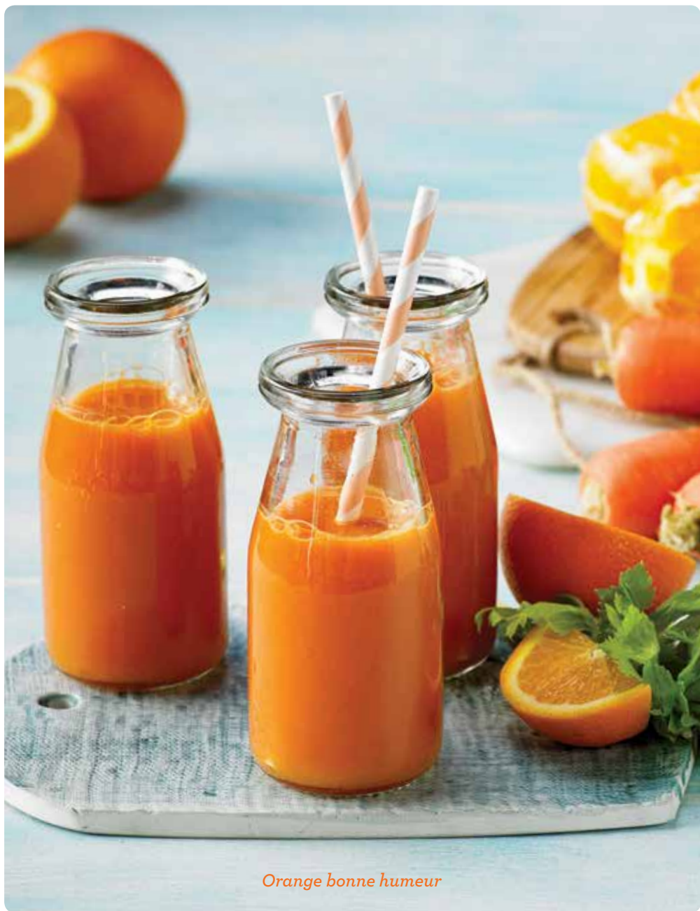
Orange bonne humeur