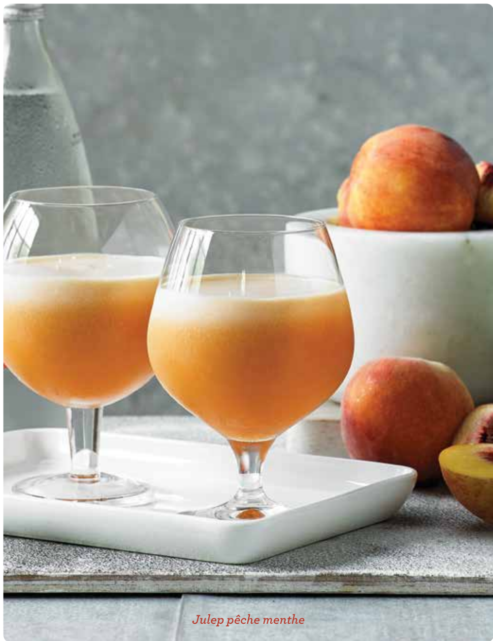
Julep pêche menthe