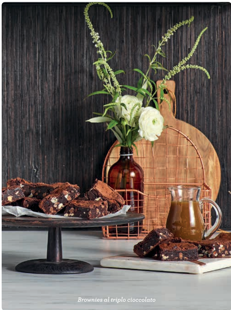
Brownies al triplo cioccolato