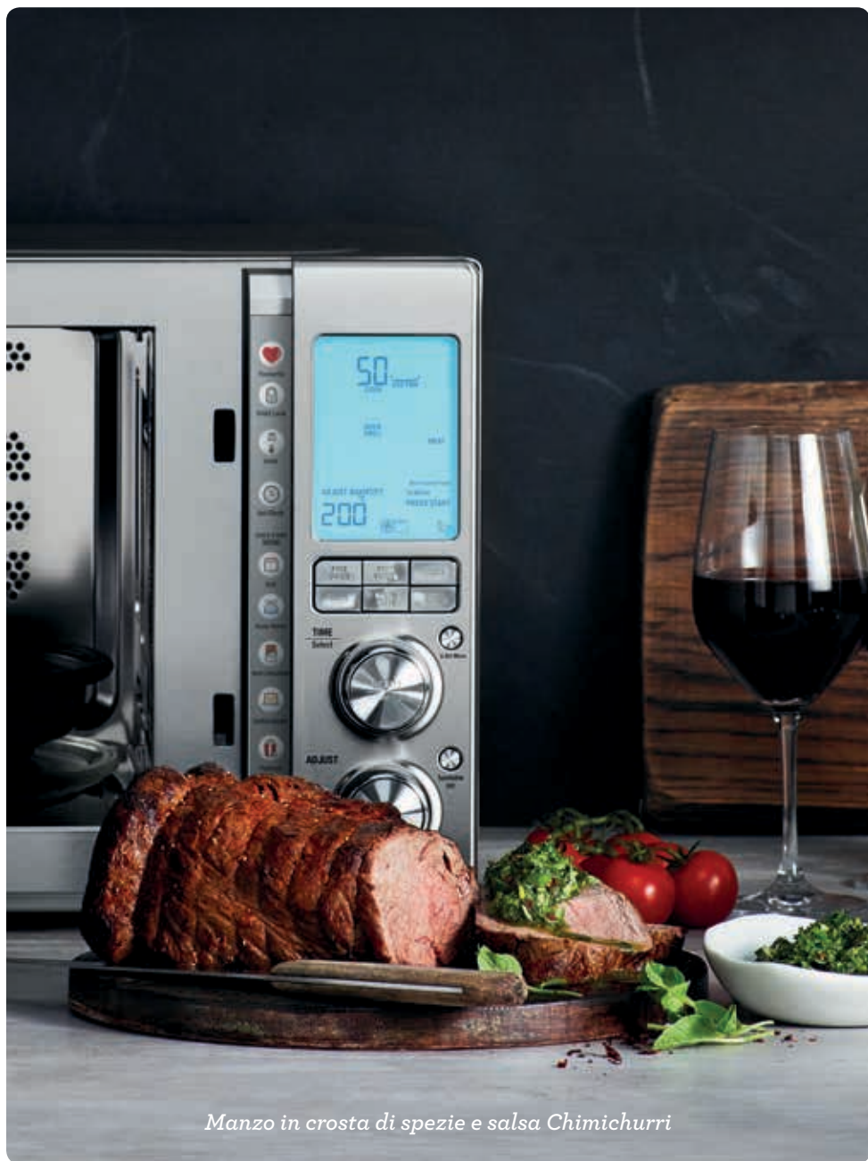
Manzo in crosta di spezie e salsa Chimichurri