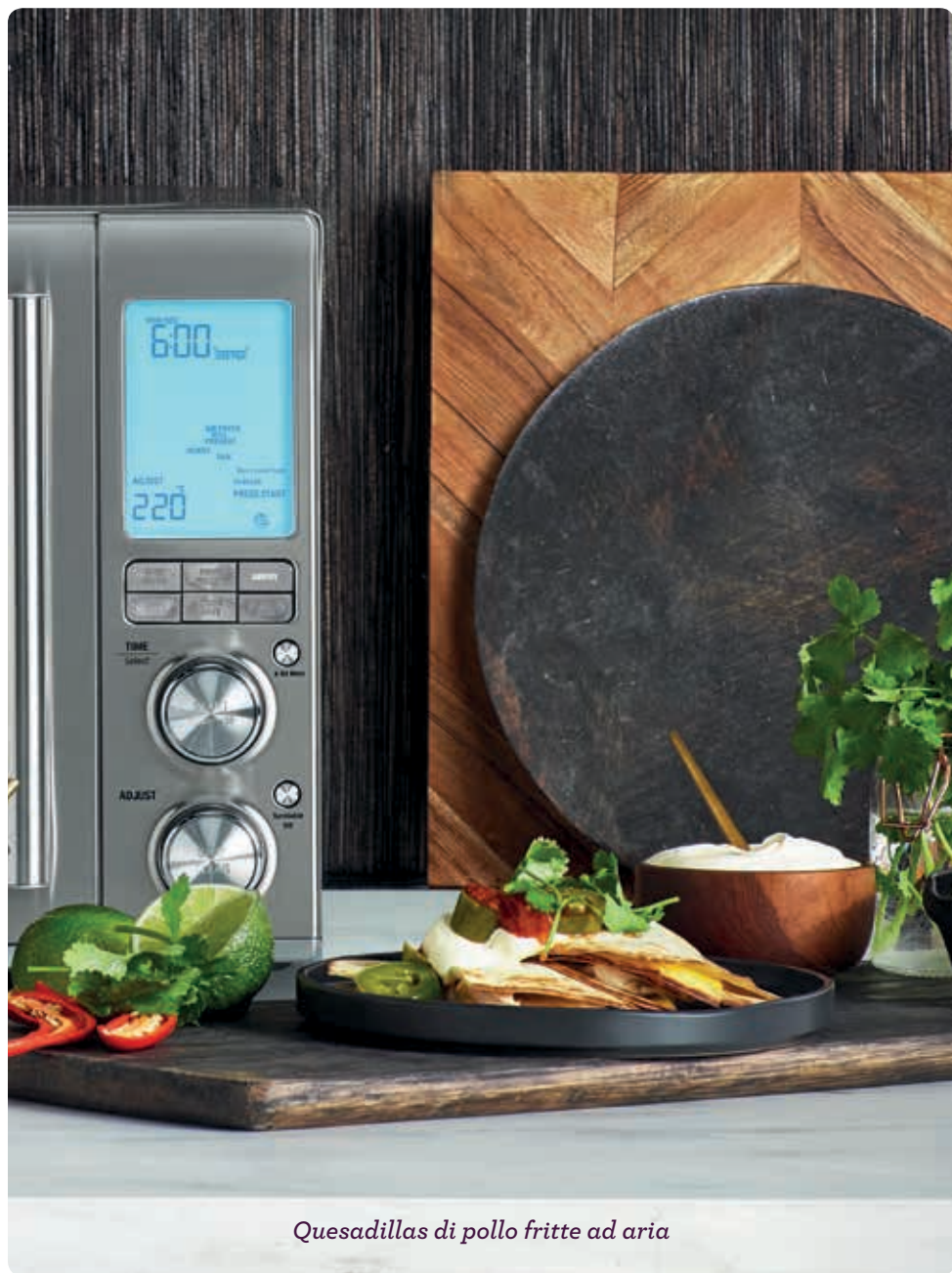
Quesadillas di pollo fritte ad aria