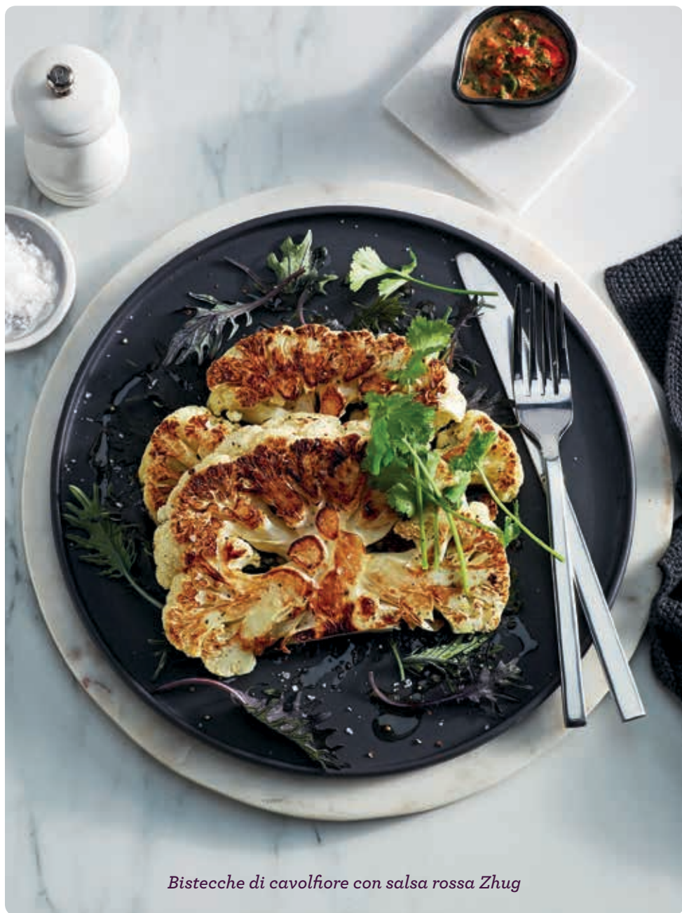
Bistecche di cavolfiore con salsa rossa Zhug