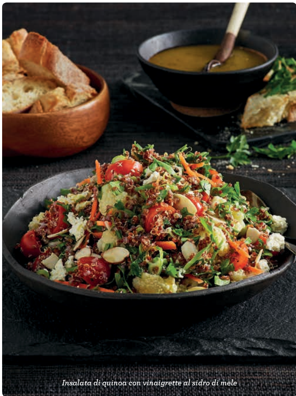
Insalata di quinoa con vinaigrette al sidro di mele