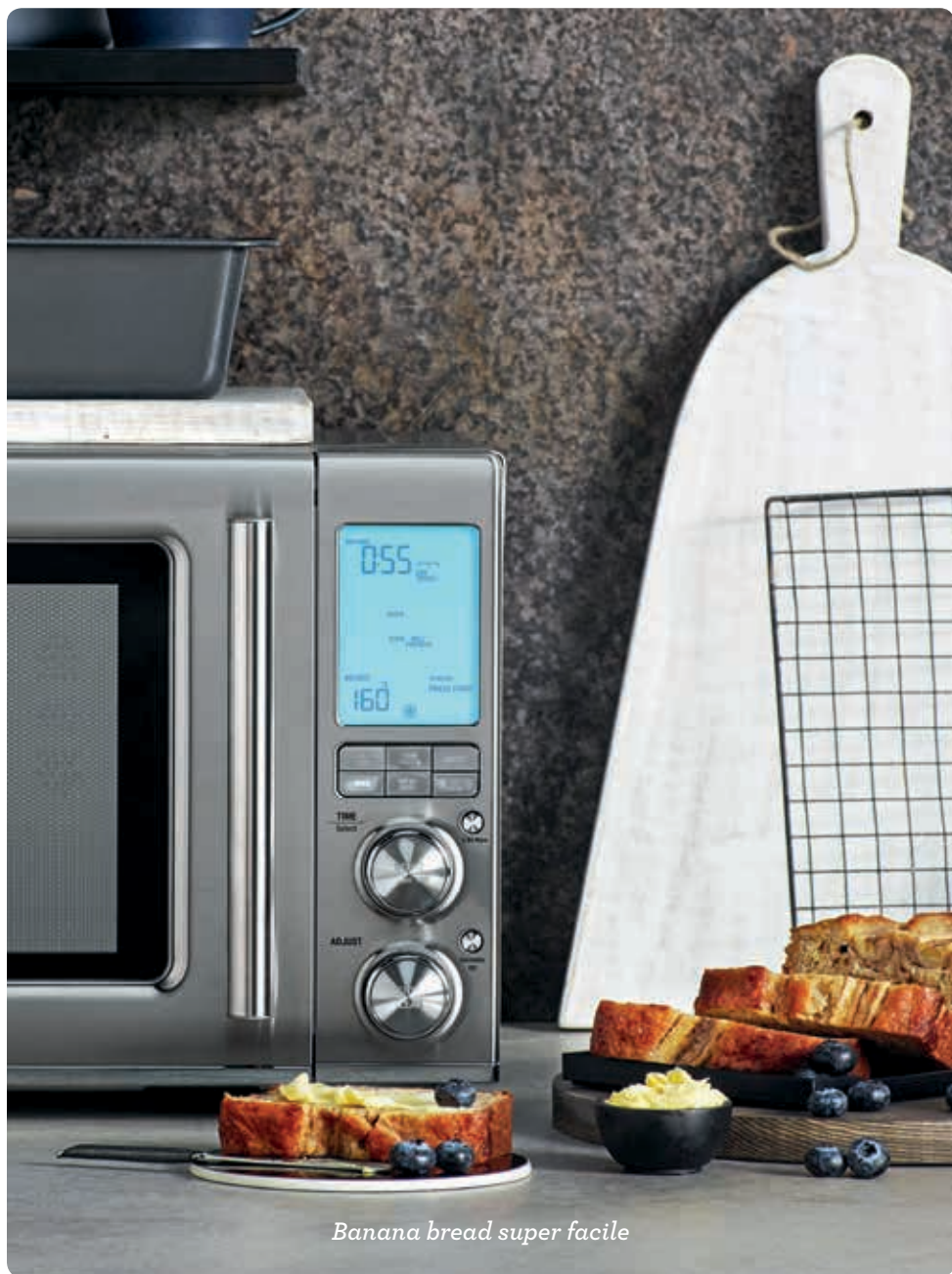
Banana bread super facile