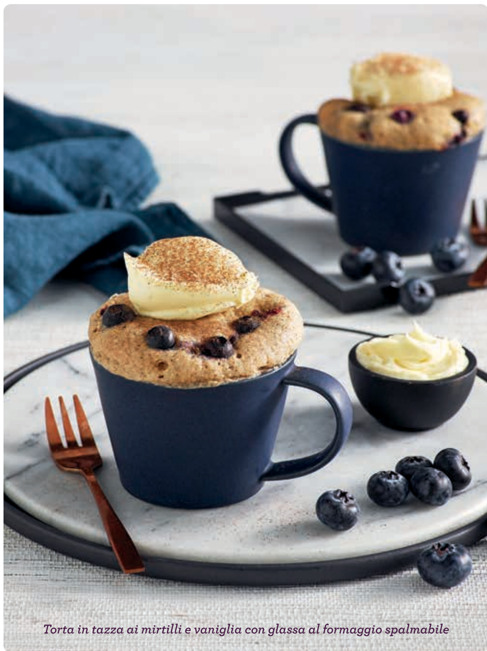
Torta in tazza ai mirtilli e vaniglia con glassa al formaggio spalmabile