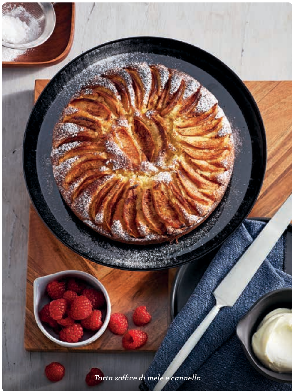
Torta soffice di mele e cannella