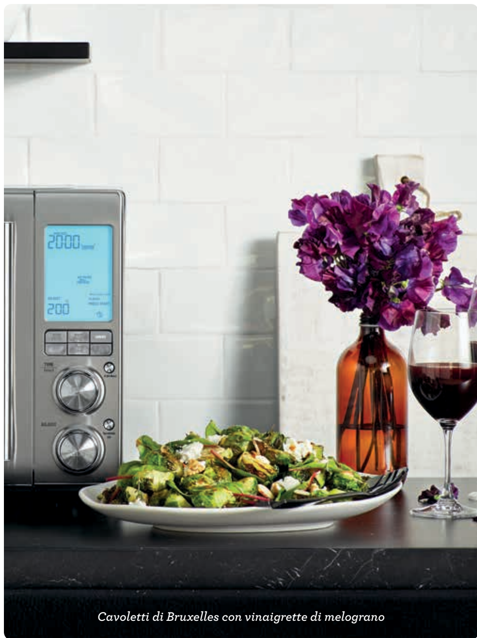
Cavoletti di Bruxelles con vinaigrette di melograno