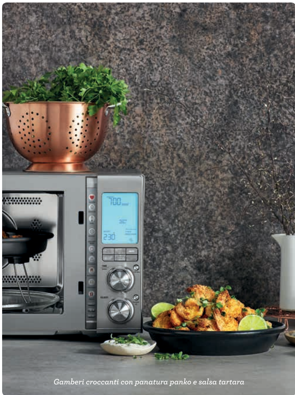
Gamberi croccanti con panatura panko e salsa tartara