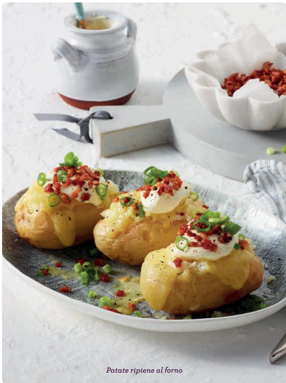
Patate ripiene al forno