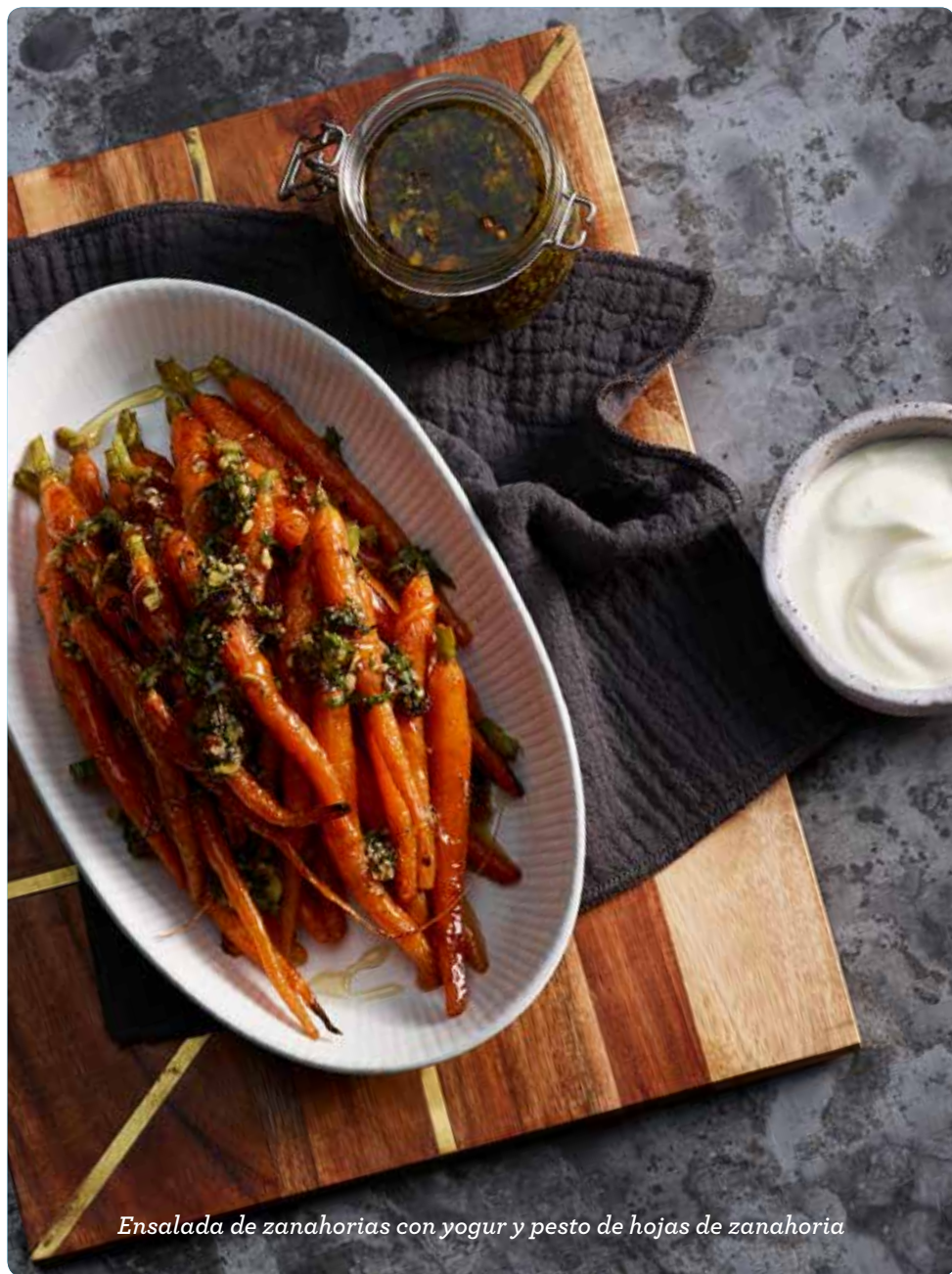
Ensalada de zanahorias con yogur y pesto de hojas de zanahoria