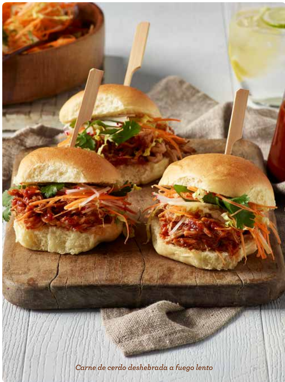
Carne de cerdo deshebrada a fuego lento