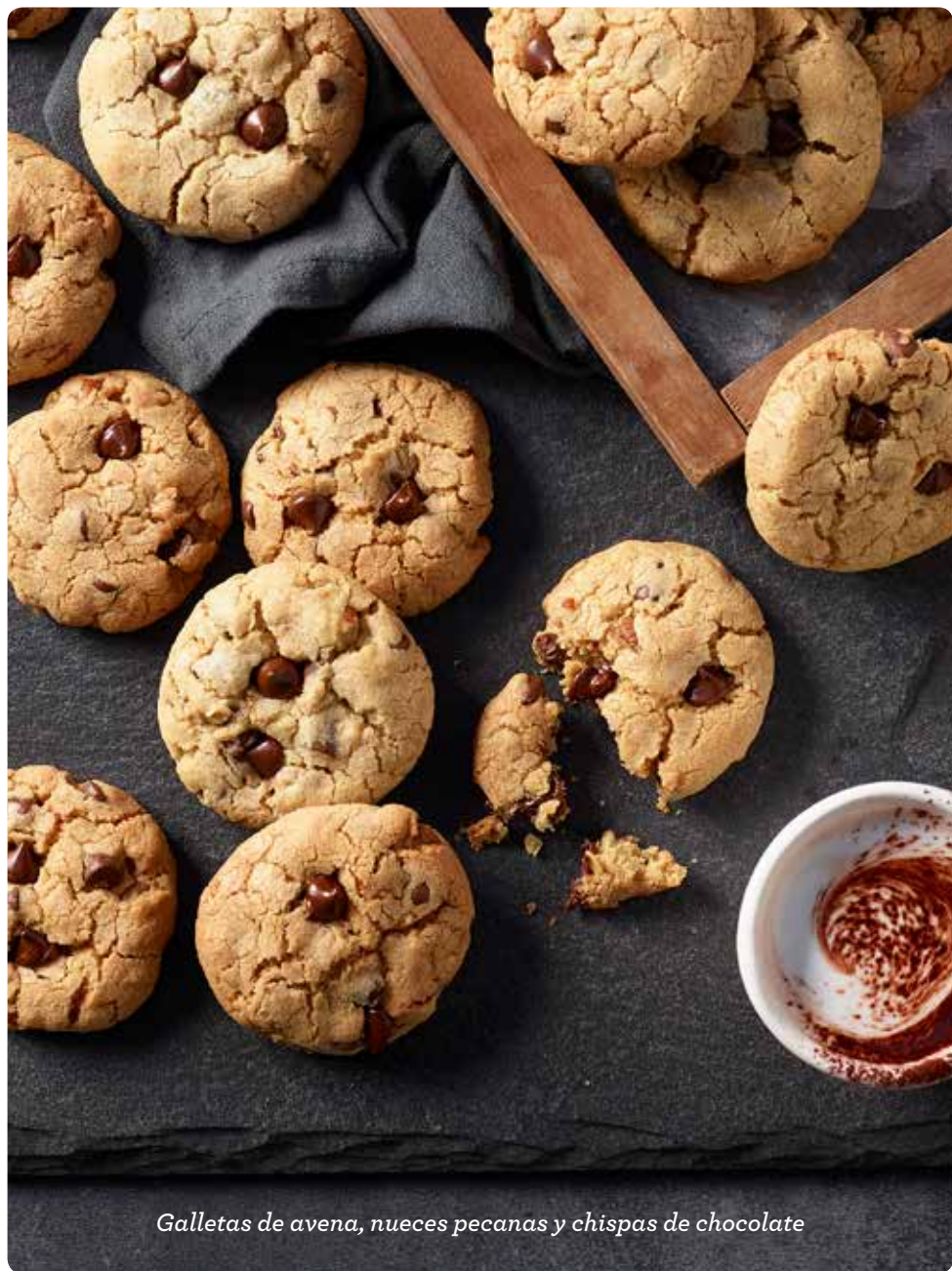
Galletas de avena, nueces pecanas y chispas de chocolate