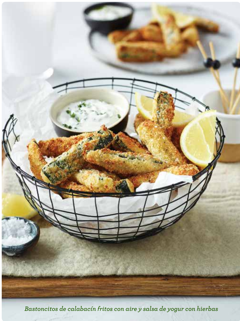
Bastoncitos de calabacín fritos con aire y salsa de yogur con hierbas