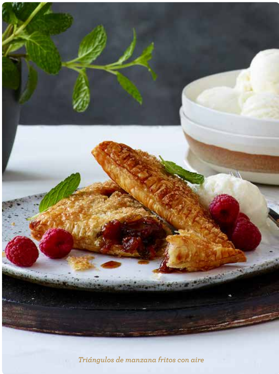
Triángulos de manzana fritos con aire