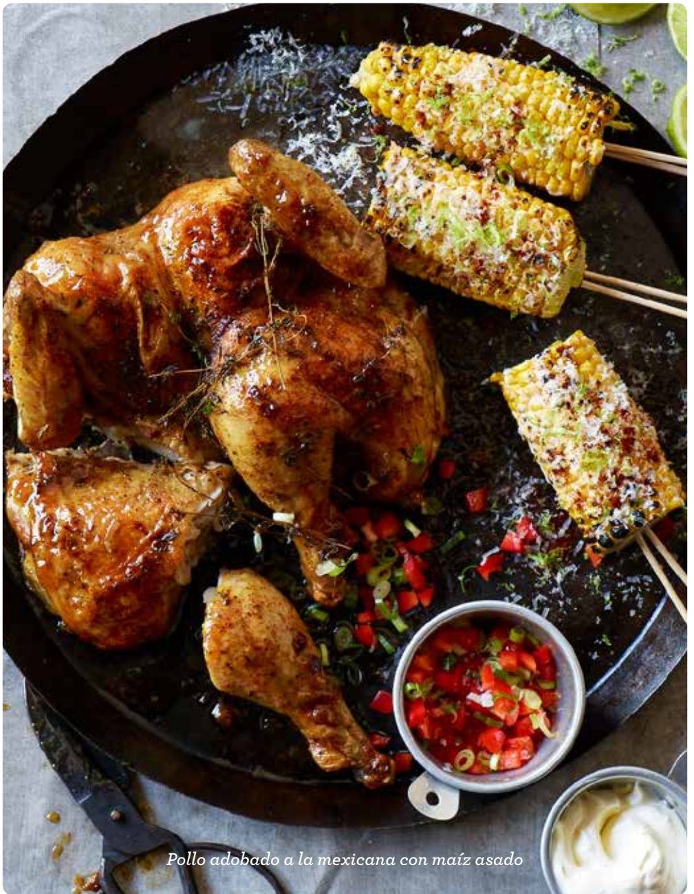
Pollo adobado a la mexicana con maíz asado