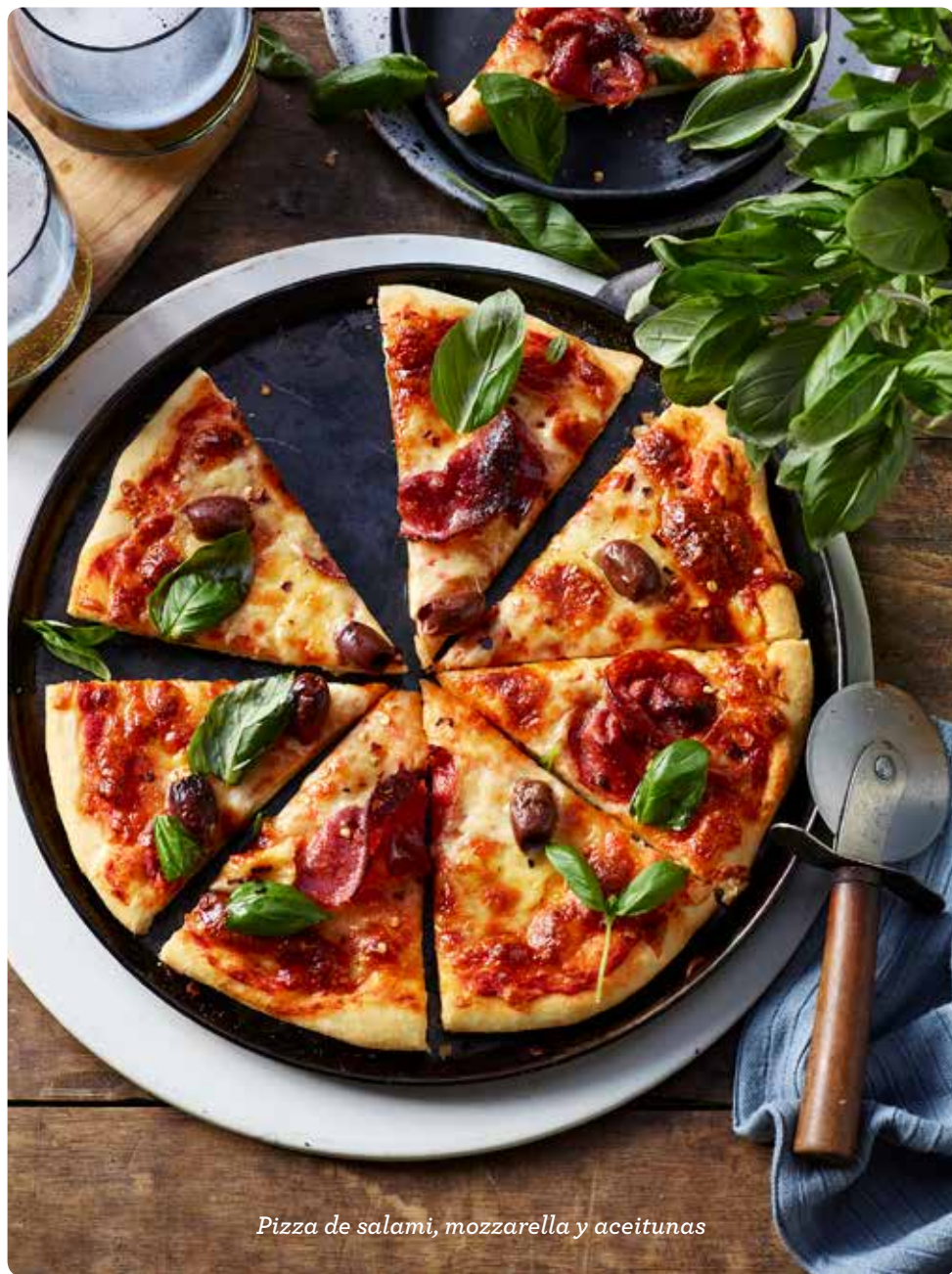
Pizza de salami, mozzarella y aceitunas