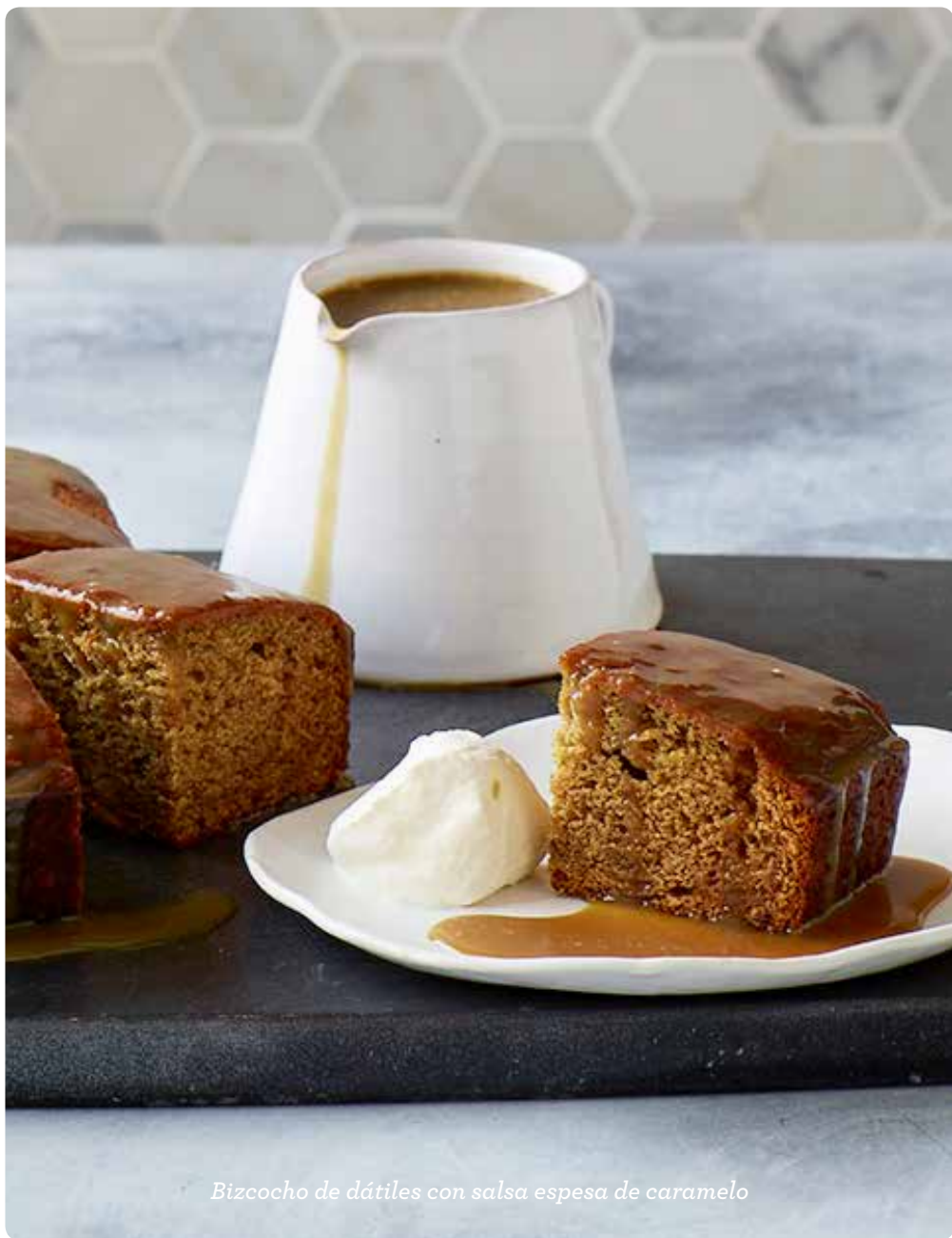
Bizcocho de dátiles con salsa espesa de caramelo