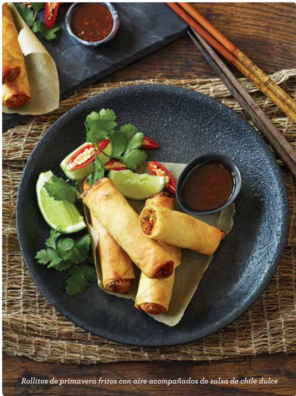
Rollitos de primavera fritos con aire acompañados de salsa de chile dulce