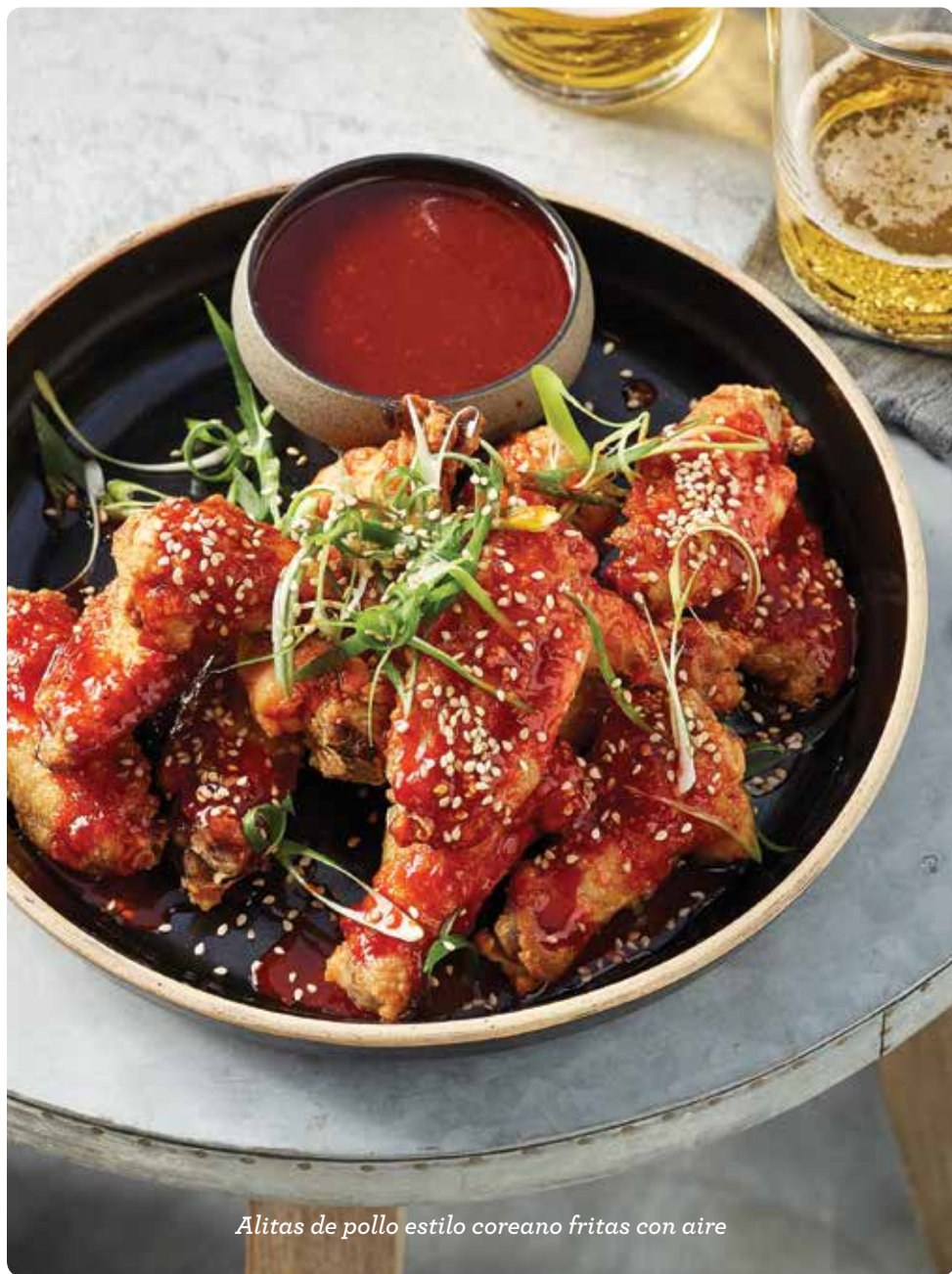
Alitas de pollo estilo coreano fritas con aire