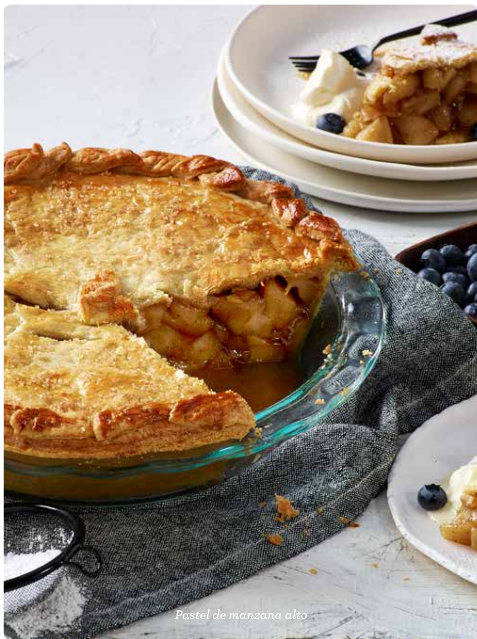
Pastel de manzana alto