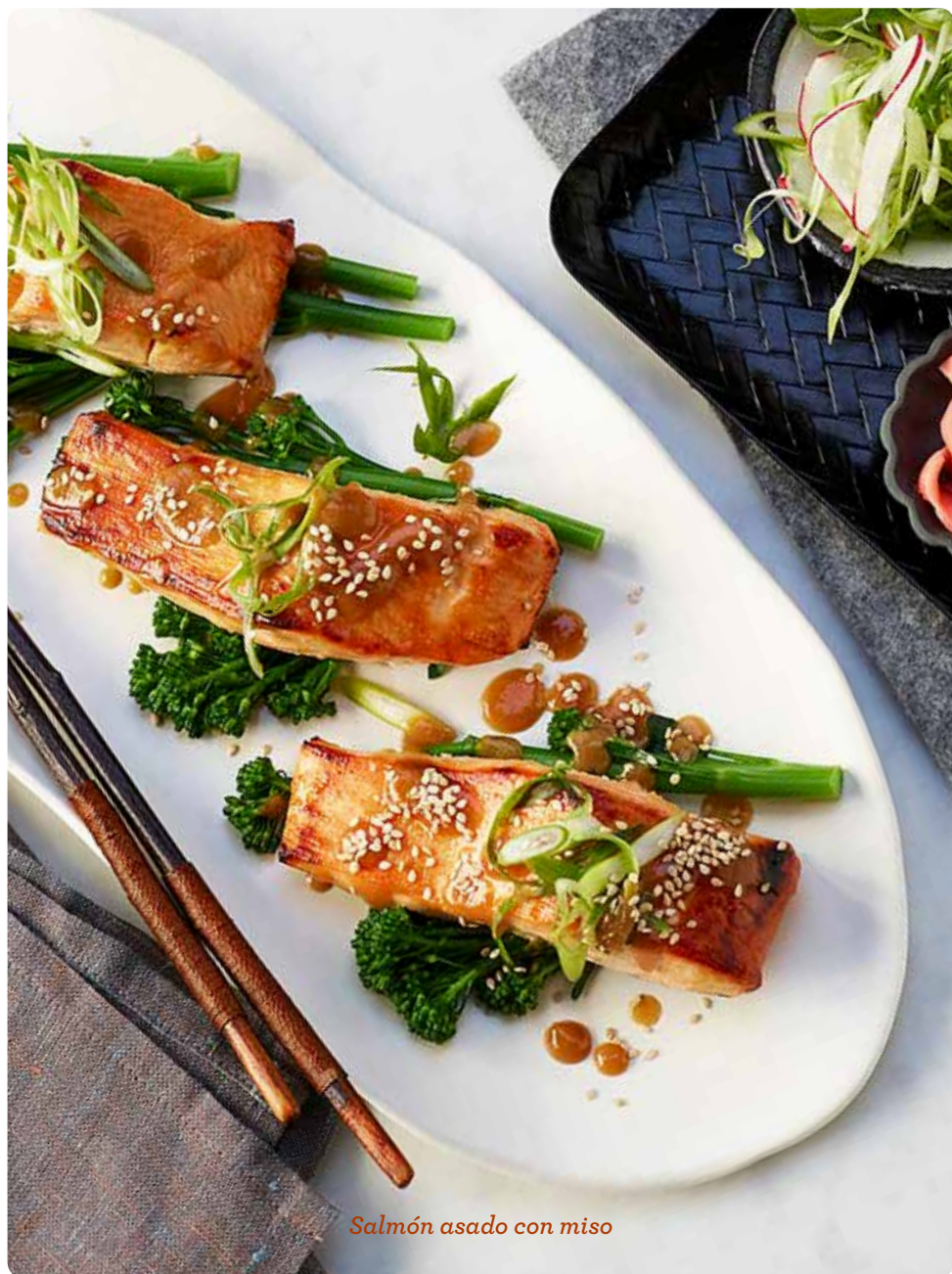
Salmón asado con miso