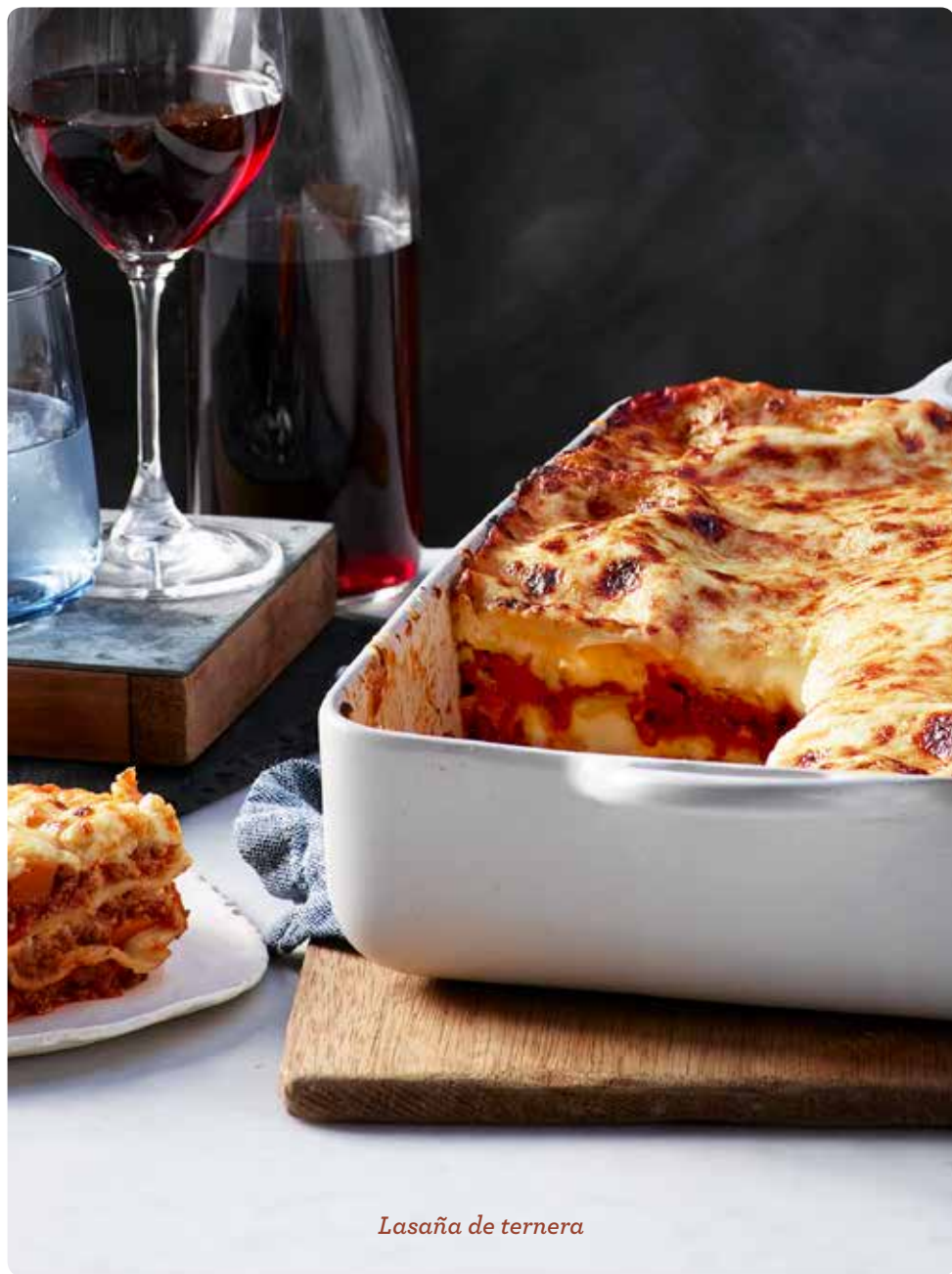
Lasaña de ternera