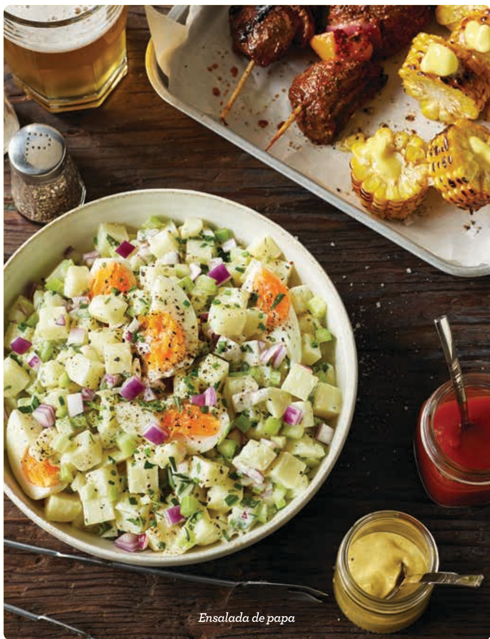
Ensalada de papa