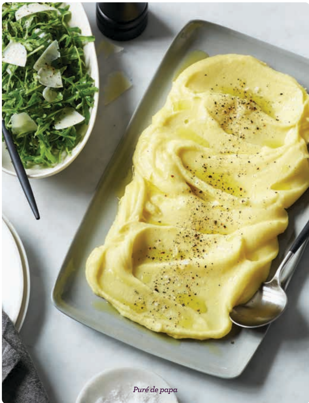
Puré de papa