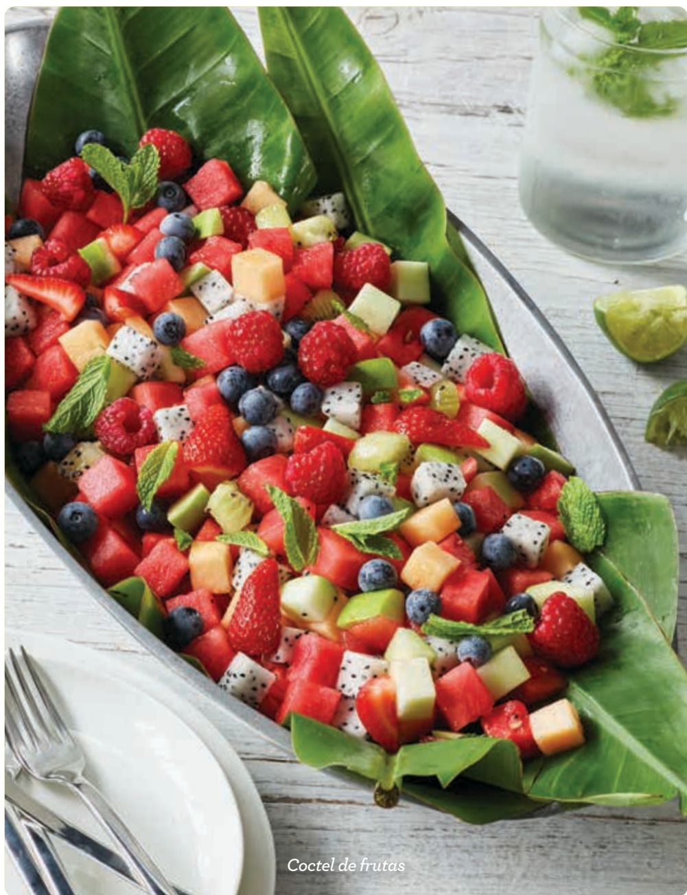
Coctel de frutas