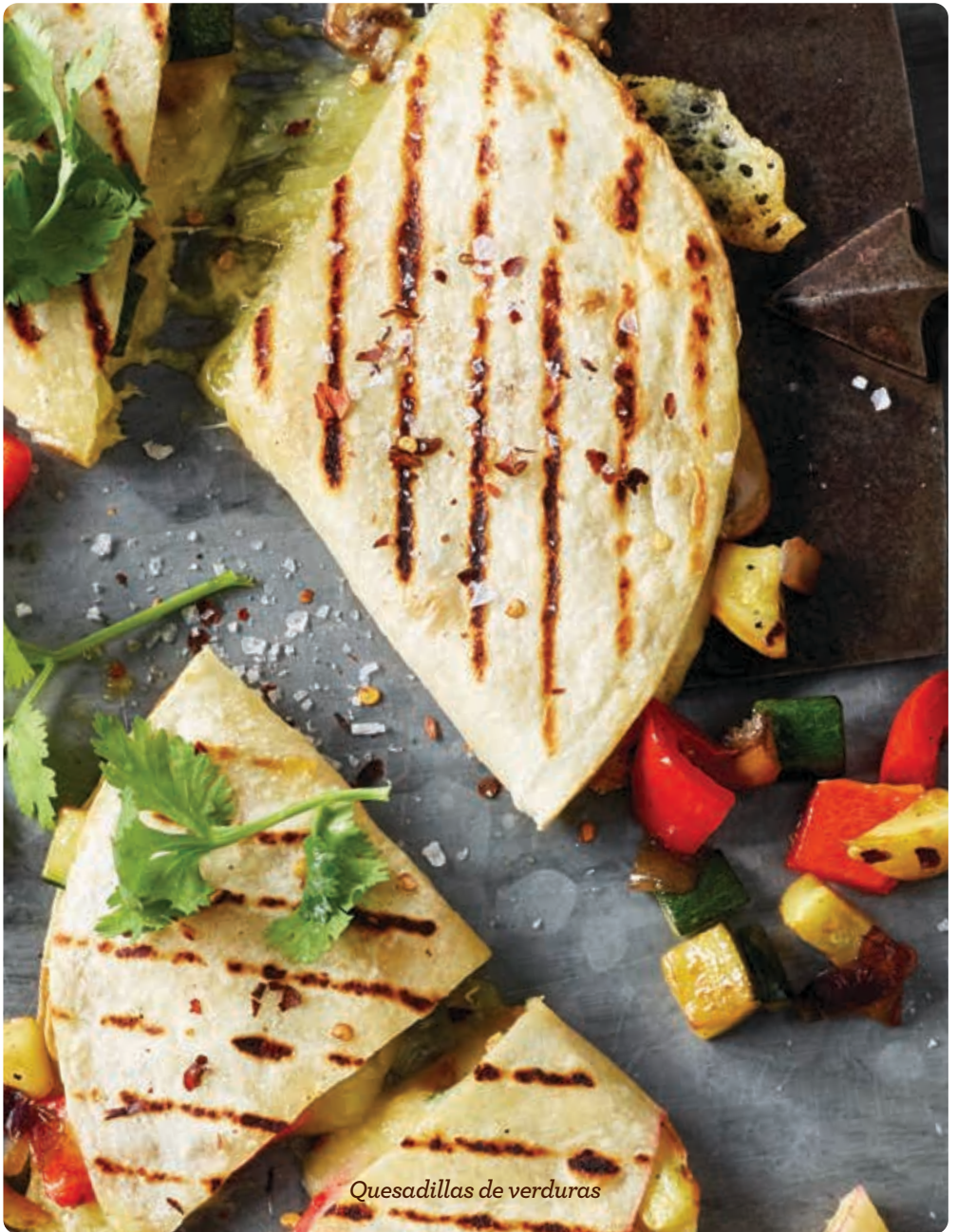
Quesadillas de verduras