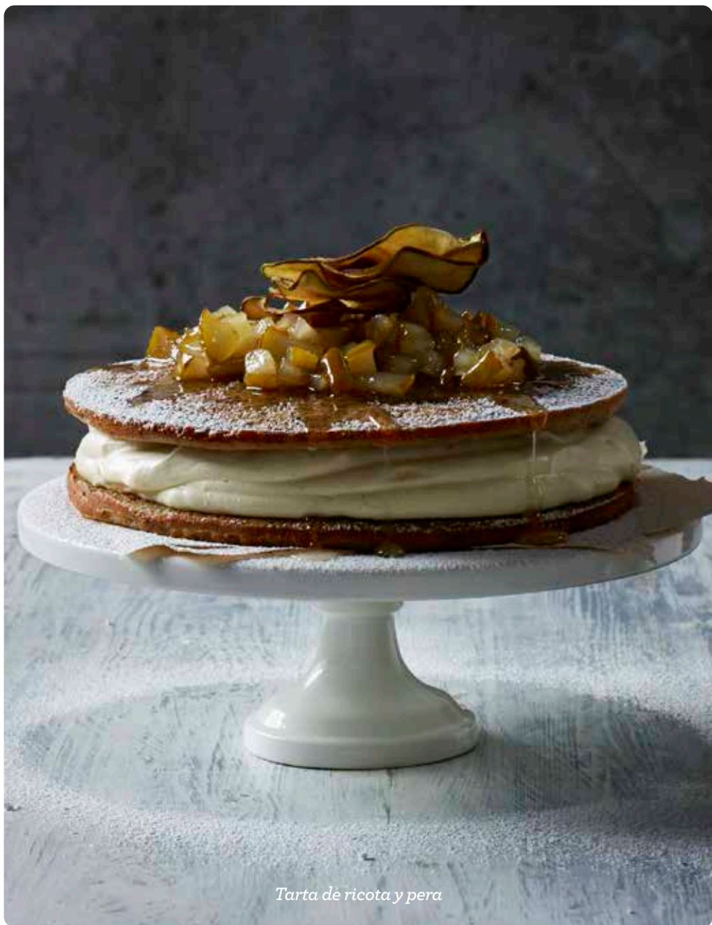
Tarta de ricota y pera