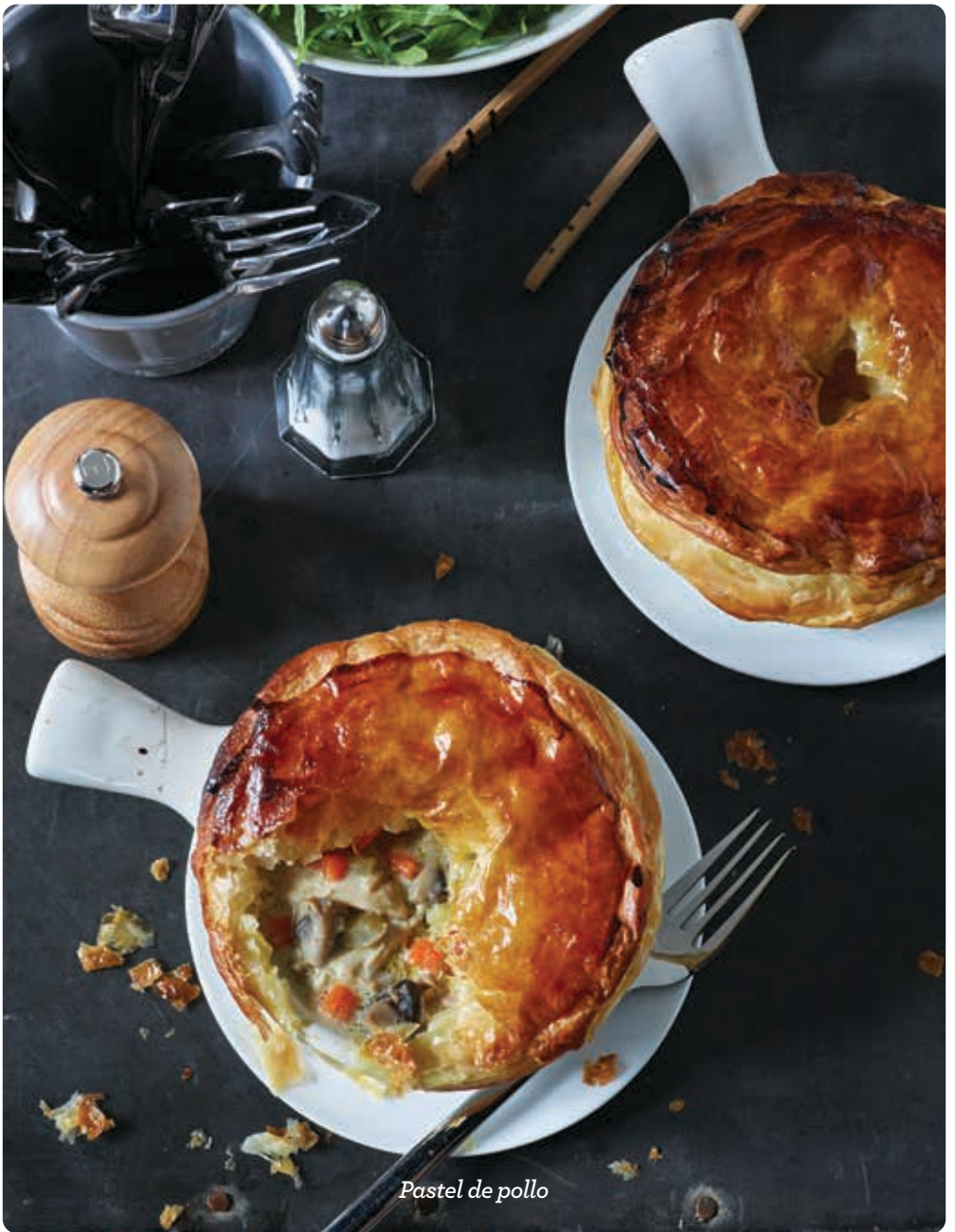
Pastel de pollo