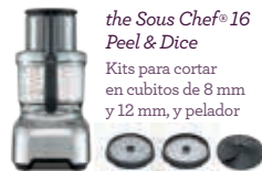
the Sous Chef® 16 Peel & Dice Kits para cortar en cubitos de 8 mm y 12 mm, y pelador

1 kg (2 libras) de papas cambray o blancas (unas 8 medianas), peladas